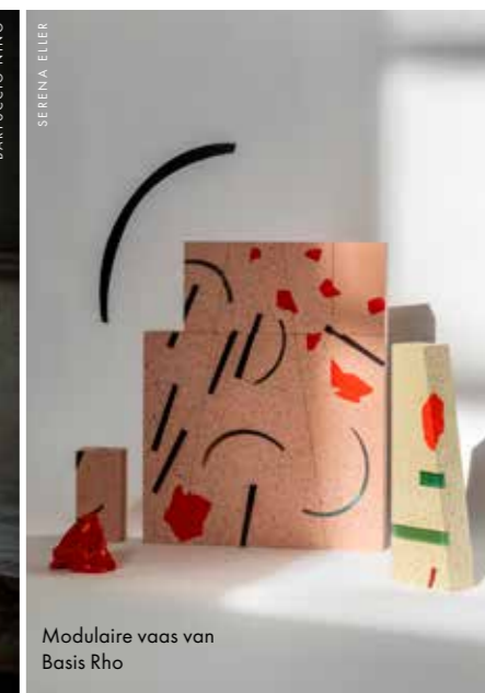
Modulaire vaas van Basis Rho