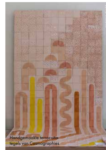
Handgemaakte terracottategels van Cosmographies