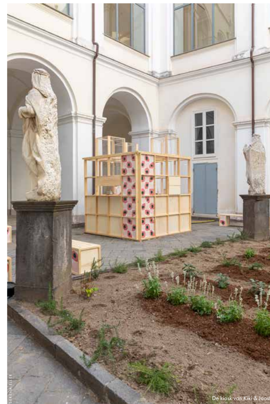
De kiosk van Kiki & Joost

Naast het hoofdevenement in het klooster gaat het duo de verbinding met de stad aan in Edit Cult, een randprogrammering op verschillende, historische locaties door heel de stad. Zo is er de presentatie van Federico Pepe in het betoverende museum van Gaetano Filangieri en laat het Franse merk La Manufacture zijn nieuwste collectie zien in het wereldberoemde operatheater San Carlo. 'Napels is bij uitstek een stad van ambachtslieden,' legt